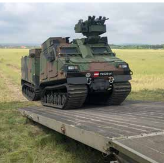
Bild oben: Zeigt das gebirgsbewegliche Fahrzeug Hägglund BvS 10. Aufgrund der hohen Mobilität finden die Spezialfahrzeuge bei den alpinen Verbänden des Bundesheeres Verwendung. Die gepanzerten Transportfahrzeuge sind hochbeweglich, da sie aus zwei Kabinen bestehen, die über ein Gelenk miteinander verbunden sind. Der Hägglund kann bis zu elf Personen transportieren und stammt aus Schweden.

Die Bilder auf dieser Seite zeigen vom Aufbau der Pionierbrücke 2000 durch Pioniere der Technischen Pionierkompanie. Im Anschluss daran fanden diverse Überfahrten statt.