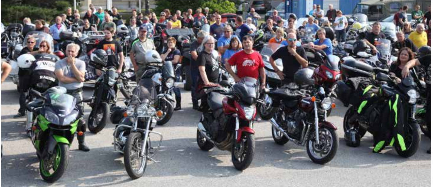
Bilder und Text: Felix Höbarth

Am Samstag, dem 24. August 2019 lud der Verein Melker Pioniere zur bereits fünften Benefiz-Bikertour in die Kaserne nach Melk. Knapp 190 Biker aus mehreren Bundesländern folgten dieser Einladung und genossen eine top organisierte Veranstaltung.