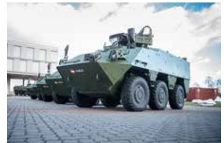
▲ Bild oben zeigt den neuen Radpanzer PANDUR EVO. Das neu entwickelte Gerät verfügt über einen erhöhten Minenschutz, mehr Platzangebot im Inneren, Fahrsicherheit (Anti-Blockier-System), eine ABC-Anlage sowie eine leistungsfähigere Elektronik.

Der Mannschaftstransportpanzer wird von der Firma General Dynamics Land Systems - Steyr hergestellt; die Fertigung erfolgt in Wien-Simmering. Insgesamt sind 179 österreichische Unternehmen aus allen neun Bundesländern an der Produktion beteiligt