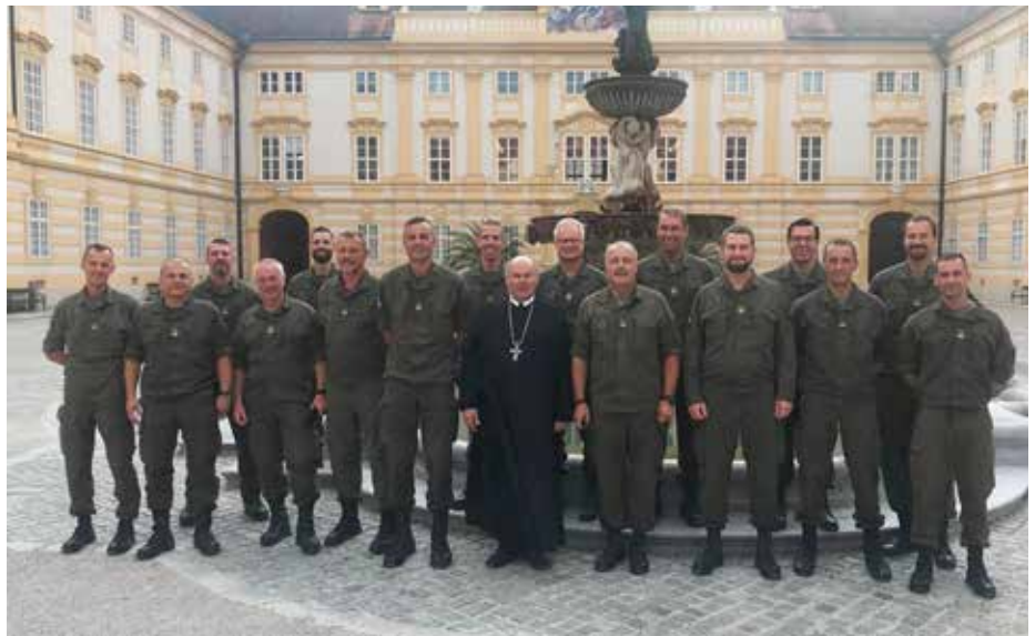
Bild oben zeigt die Teilnehmer der 4. Kommandantenbesprechung 3. Jägerbrigade (BSK). Diese fand am 27. und am 28. August 2019 in Melk statt. Das Abendprogramm sah dabei einen Besuch im Stift Melk vor.