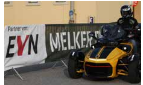
Bild rechts: Die Teilnehmer erfahren während der Veranstaltung ein vom Verein Melker Pioniere finanziertes spezielles Foto-Service. Alle Biker werden demnach beim Eintreffen fotografiert und können im Anschluss an die Ausfahrt das fertige Bild kostenlos mit nach Hause nehmen.

Der Pädagogische Leiter der Außenwohngruppen Helfried Riegler nahm selbst an der Ausfahrt teil und bedankte sich bei den Veranstaltern.