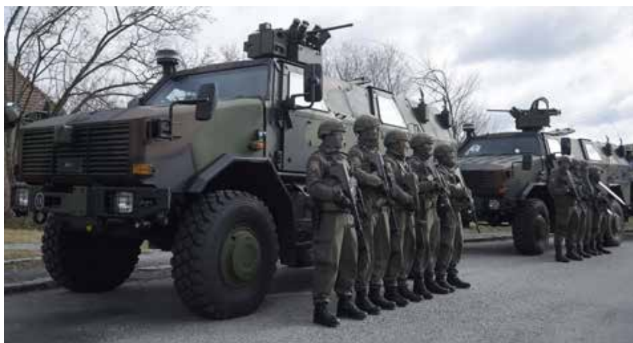
Bild oben zeigt das Allschutztransportfahrzeug Dingo (ATF DINGO) beim Jägerbataillon 33 samt angetretener Besatzung.

erreicht mit einem Scharfschießen Ende des Jahres einen wichtigen Meilenstein.