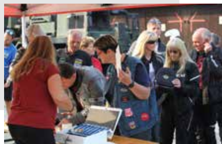
Bilder auf dieser Seite zeigen vom Eintreffen und der Registrierung der Teilnehmer. Knapp 190 Biker samt Beifahrer folgten der Einladung zum Charity-Event in die Biragokaserne.