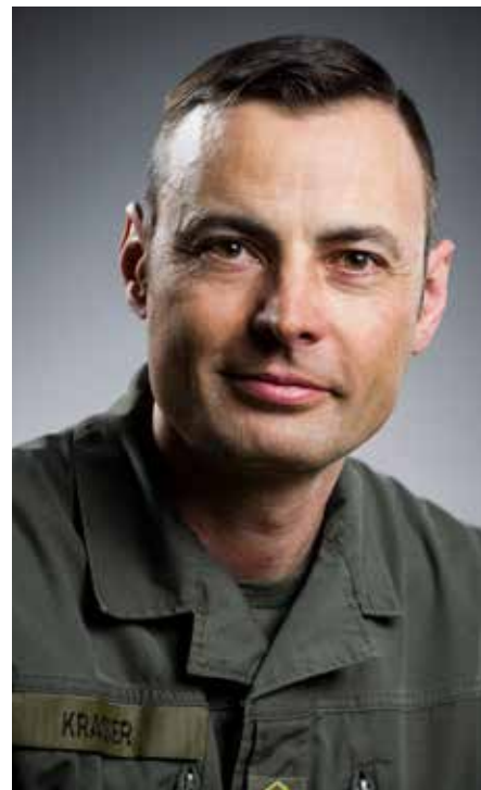
Oberst des Generalstabsdienstes Mag. Karl Krasser, Kommandant 3. Jägerbrigade (BSK).

Das Jägerbataillon 33 in Zwölfaxing hat neben dem Allschutztransportfahrzeug Dingo ebenfalls den Pandur A2 in die Nutzung gebracht und wird diese Fähigkeit in Zukunft erweitern. Im Bereich des Aufklärungs- und Artilleriebataillons 3 ist die Auf-