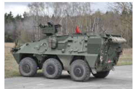
▲ Bild oben zeigt den Radpanzer Pandur A2. Die wesentlichen Änderungen zum Vorgänger finden sich bei der Verbundpanzerung, einem Laserentfernungsmesser, dem gesteigerten Minenschutz, der elektronisch bedienbaren Waffenstation und der gesteigerten Nacht- bzw. Tagsichtfähigkeit. Zudem verfügt das Gefechtsfahrzeug über eine Mehrfachwurfanlage für Nebel-, Spreng- oder Tränengasgranaten.

Der Mannschaftstransportpanzer wird von der Firma General Dynamics Land Systems - Steyr hergestellt; die Fertigung erfolgt in Wien-Simmering. Insgesamt sind 179 österreichische Unternehmen aus allen neun Bundesländern an der Produktion beteiligt