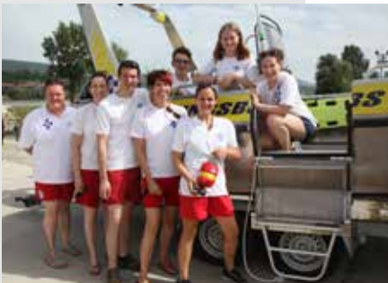
Bild links: Zeigt die motivierten Teilnehmer der Wasserrettung aus Ybbs. Diese boten eine tolle Station, die von den Gästen gerne besucht wurde.