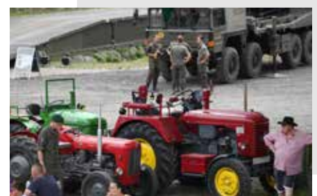
Bild rechts: Die Vereinsmitglieder der Historischen Landtechnik Österreich aus Leiben nahmen auch heuer wieder mit mehreren alten Traktoren teil. Danke dafür.