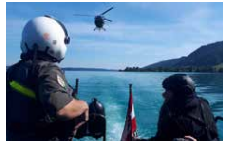
Bild oben: Szene aus der Ausbildungskooperation mit Soldaten des Jagdkommandos. Dabei wurden unter anderem Notverfahren zur Rettung bei Seenotfällen trainiert. Die Geschichte dazu lesen Sie auf Seite 6.