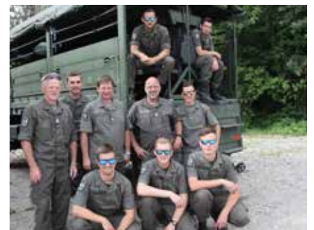
Bild unten: Sorgen mit den neuen MAN-Fahrerschullastkraftwagen für ein unfallfreies und gut organisiertes Geländefahren, das Team der Fahrschule Melk.