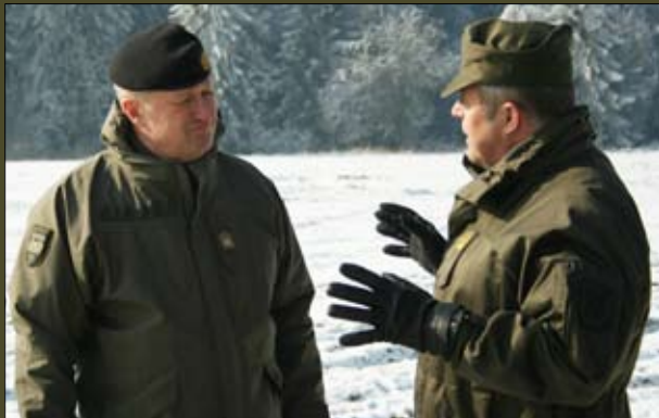
Bild oben: Generalleutnant Höfler im Gespräch mit dem Kommandanten der Melker Pioniere. Natürlich ging es dabei vorrangig um die dringend notwendige Erweiterung und dem Ausbau der Melker Bestandskaserne.