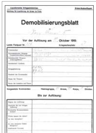
Bild: Demobilisierungsblatt des Sappeurbataillons Nr. 5. Dieses trägt den Kopfstempel „Liquidierendes Kriegsministerium. Abteilung für Liquidierung der Armee im Felde.“