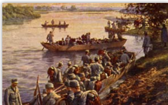
Bild: Weltkrieg 1914-1915

„Es war mein sehnlichster Wunsch, die Jahre, die Mir durch Gottes Gnade noch beschieden sind, Werken des Friedens zu weihen und Meine Völker von den schweren Opfern und Lasten des Krieges zu bewahren. Im Rate der Vorsehung ward es anders beschlossen. Die Umtriebe eines haßerfüllten Gegners zwingen Mich, zur Wahrung der Ehre Meiner Monarchie, zum Schutze ihres Ansehens und ihrer Machtstellung, zur Sicherung ihres Besitzstandes nach langen Jahren zum Schwerte zu greifen....“