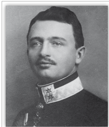
Bild: Kaiser Karl I. und König Karl IV. von Ungarn. Als letzter Kaiser von Österreich verzichtete er am 11. November 1918 auf jeden Anteil an den Staatsgeschäften, am 13. November in gleicher Weise als König von Ungarn.

In der nächsten Ausgabe: Das Volkswehrebataillon Melk Zwischenkriegszeit