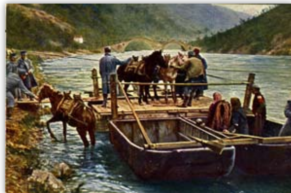
Bild: Weltkrieg 1914-1918

Überschiffung der Verpflegsstaffel über den schwarzen Drin (an der mazedonisch-albanischen Grenze).