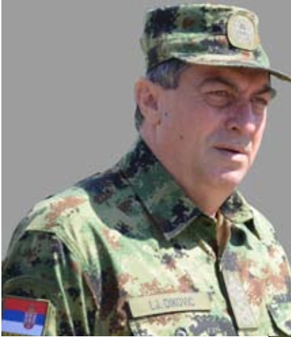
Bild oben: Zeigt Generalleutnant Ljubisa Dikovic während seines Besuches in Melk am 15. Juli 2015.

Die Streitkräfte Serbiens zählen etwa 37.000 Mann, wovon 6.500 auf die Luftwaffe entfallen. Die Wehrpflicht wurde 2011 abgeschafft. Mit einer Resolution des serbischen Parlaments im Jahr 2007 hat sich Serbien als „militärisch neutraler Staat“ deklariert. Nunmehr besuchte der Generalstabschef der Serbischen Armee Ljubisa Dikovic mit einer Abordnung das Österreichische Bundesheer. Sein Weg führte ihn auch nach Melk zu den Pionieren.