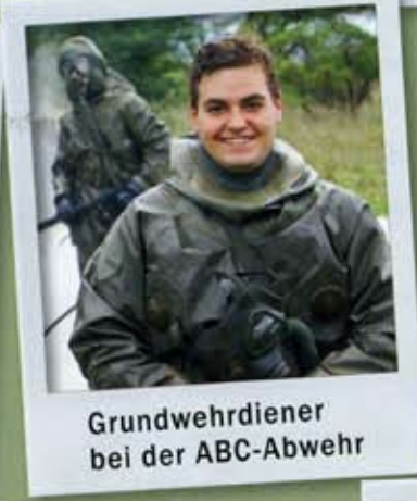
Grundwehrdiener bei der ABC-Abwehr