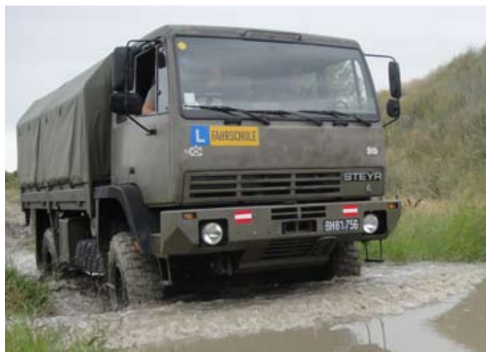
Bild oben: Der geländegängige LKW Steyr 12M18. Die Fahrausbildung erfolgt grundsätzlich mit diesem für einfache Transportaufgaben bestimmten Fahrzeugtyp. Dabei ist der praktische Fahrbetrieb - auch im schweren Gelände - klares Schwergewicht.