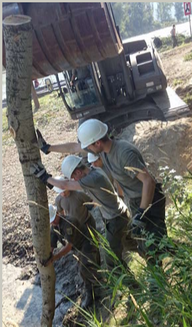
Bild oben: Milizsoldaten der Pionierkompanie Niederösterreich während der Waffenübung (bWÜ) im August 2015 bei Hundsheim in Mautern. Dort errichteten die Miliz-Pionierkameraden eine Ufersicherung in perfekter Ausführung.