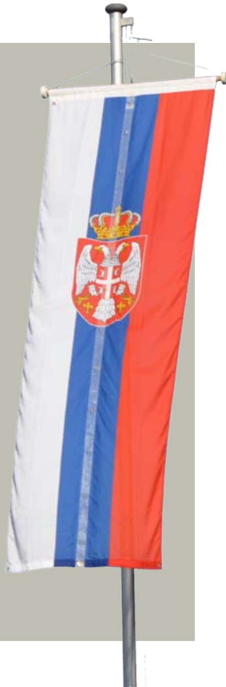
Bilderleiste rechts: Imagebilder der serbischen Flotte.

Die überwiegende Mehrheit der Einwohner Serbiens sind Christen, davon bekennen sich mit etwa 6,3 Millionen zur serbisch-orthodoxen Kirche. Die Hauptstadt ist Belgrad.