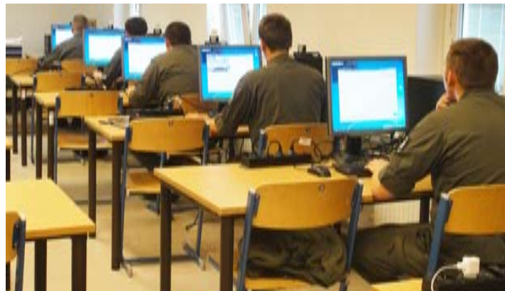
Bild oben: Die Prüfung des theoretischen Wissens wird mit der bataillonseigenen Prüfstelle, bestehend aus sechs Prüfcomputern, abgenommen.