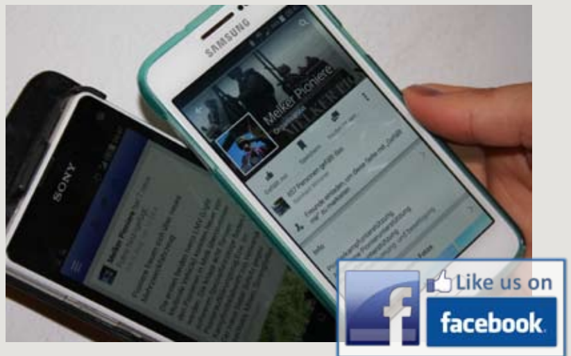
Bild oben zeigt die Nutzung der Seite auf Smartphones. So können in optimaler Geschwindigkeit und ansprechender Ansicht Beiträge in sekundschnelle quasi um die Welt geschickt werden. Wenn Sie Facebook-Nutzer sind und die Seite besuchen, würden wir uns über ein Like Ihrerseits freuen.

Nunmehr hat die Verbandsführung im Sinne der operativen Kommunikation entschieden, diese Plattform als Informationsmedium zu nutzen und eine Seite Melker Pioniere eingerichtet. Darin werden aktuelle Themen, laufende Einsätze, ansprechende Bilder und geplante Veranstaltungen gepostet. Zudem stellen wir auf diesen Seiten die moderne Geräteausstattung dar und verknüpfen jeweils mit der Website des Verbandes ( melker-pioniere.at ). Themen also, die auf Grund der Beitragsreichweite entsprechend oft gelesen und mit einem Like ( Gefällt mir ) markiert werden.