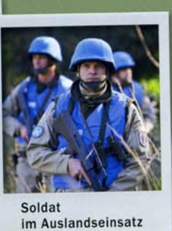
Soldat im Auslandseinsatz